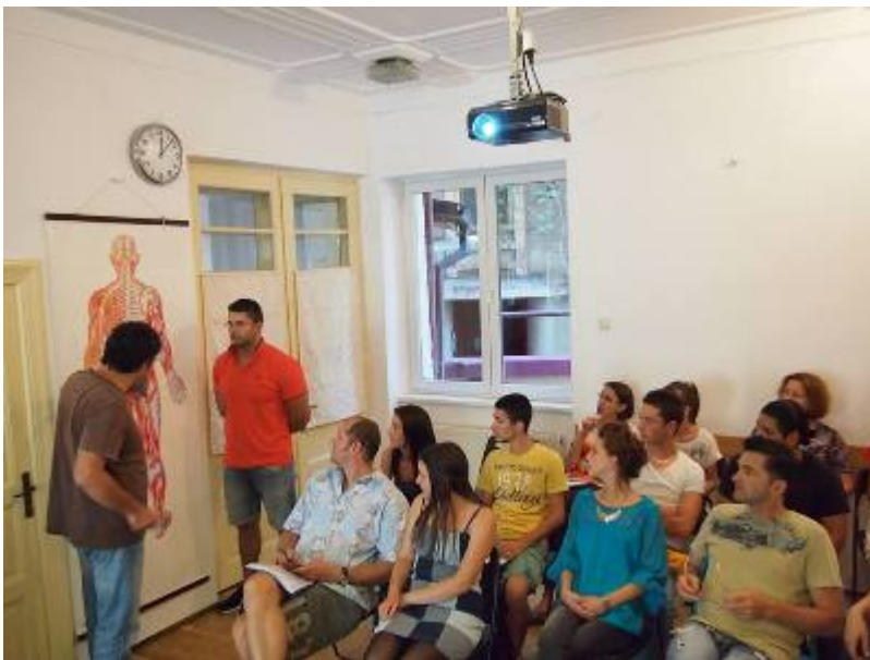
Casa de sănătate □ Dragomir – Curs masaj terapeutic

Încă din timpul practicii ni s-a spus că peste tot se caută numai fete , nu contează că sunt spa-uri, centre de recuperare medicală sau saloane de înfrumusețare și c-o să fie foarte greu să ne găsim undeva de lucru.